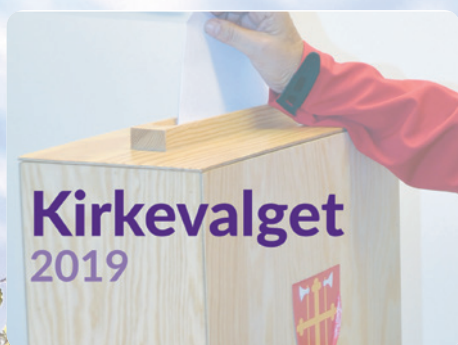
Resultater fra Kirkevalget. SE SIDE 5