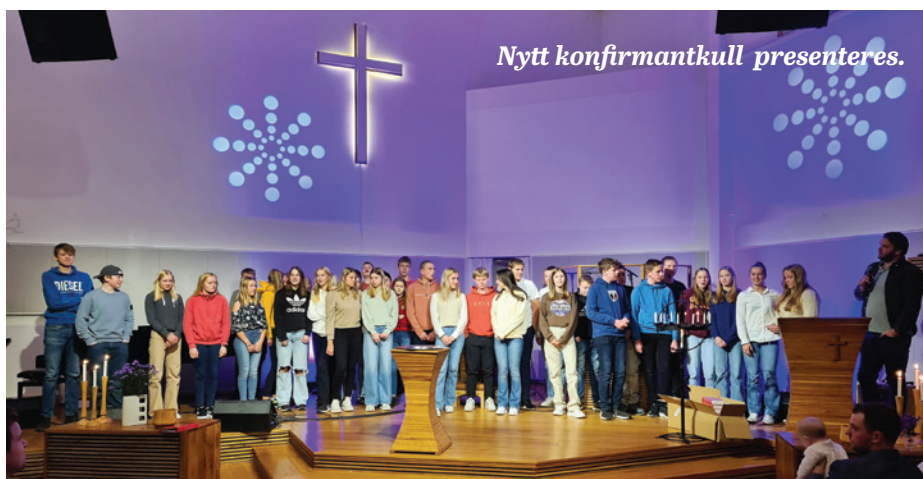
Nytt konfirmantkull presenteres.