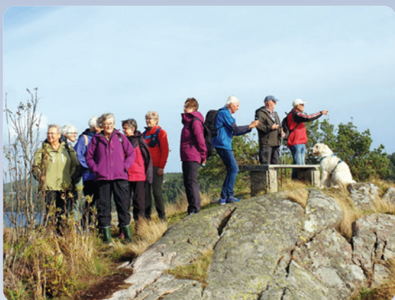
Mandagsturene starter opp igjen