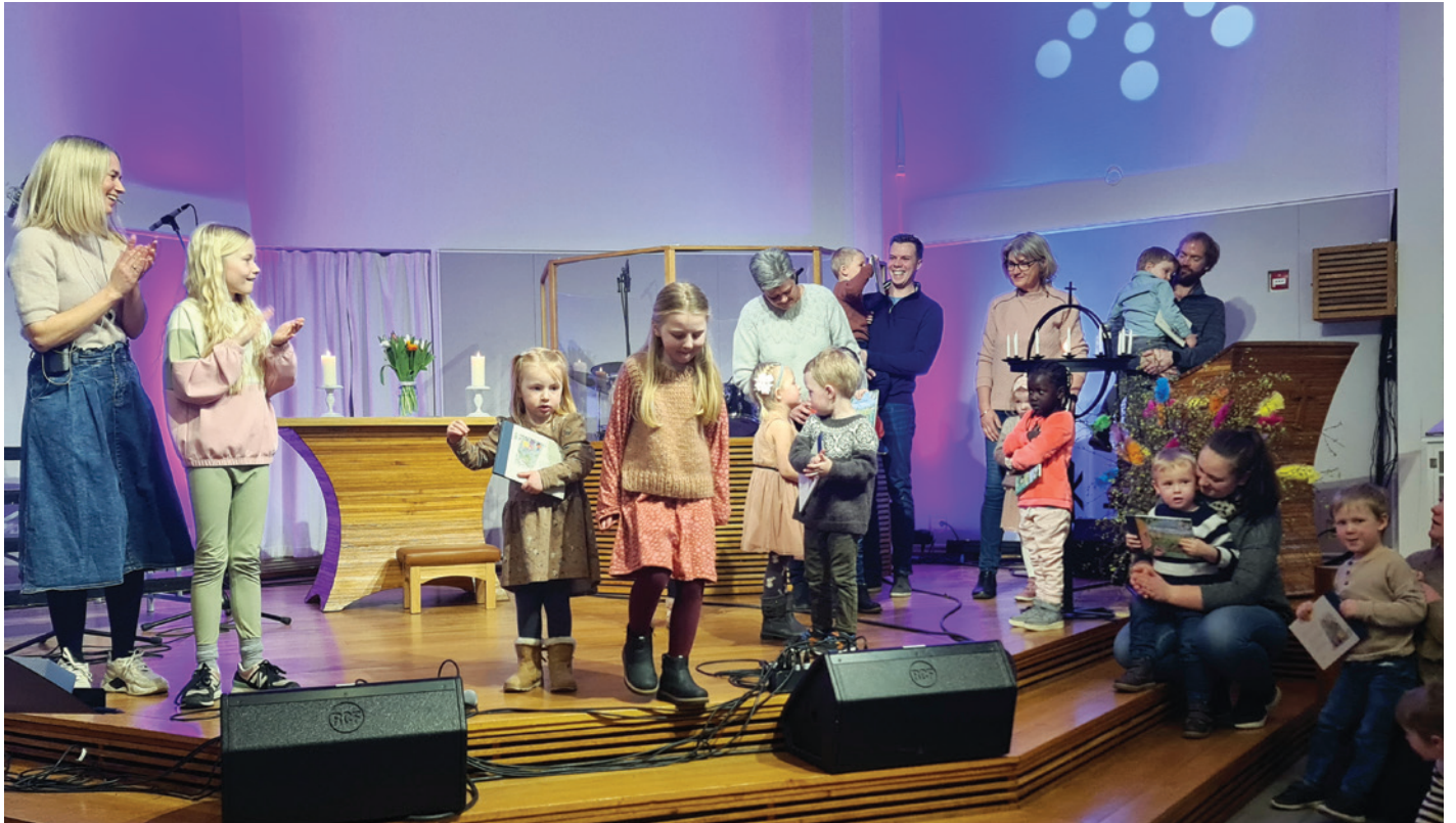
GUDSTJENESTEN 13. MARS med Soul Kids og bøker til fireåringene.