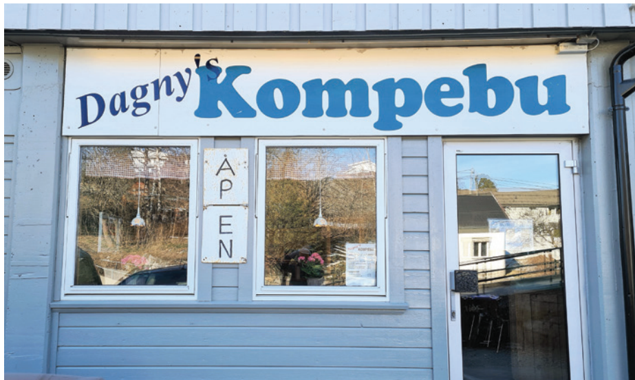
Dagnys Kompebua holder åpent fra tirsdag til fredag.

-Ja, jeg skulle bare ut i hagen og høste litt frukt. Da tråkket jeg på et eple, og det endte med fall og brudd i ankelen, heldigvis et greit brudd, men det ble åtte uker med gips. Og sannelig fikk jeg en