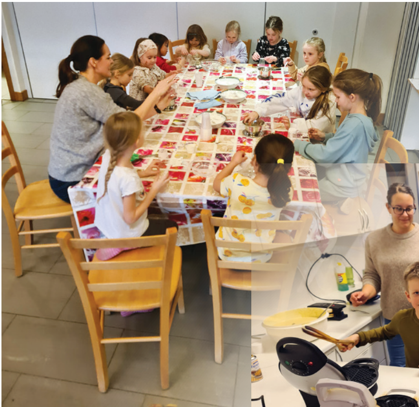
LAGEGRUPPE OG KJØKKENGRUPPE på mandagsklubben