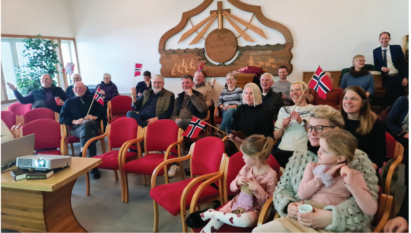
OL SENDING I FORKANT AV GUDSTJENESTEN.