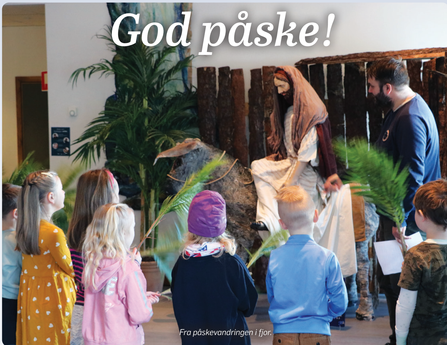
Fra påskevandringen i fjor.