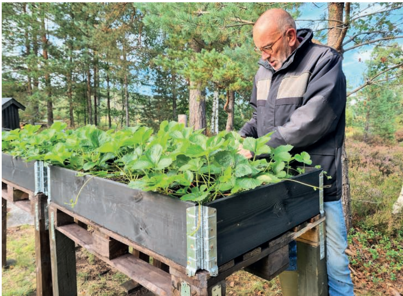
Jordbærrydning er en viktig hytte-aktivitet, og her finner hans grønne fingre stiklinger som kan øke produksjonen til neste år.