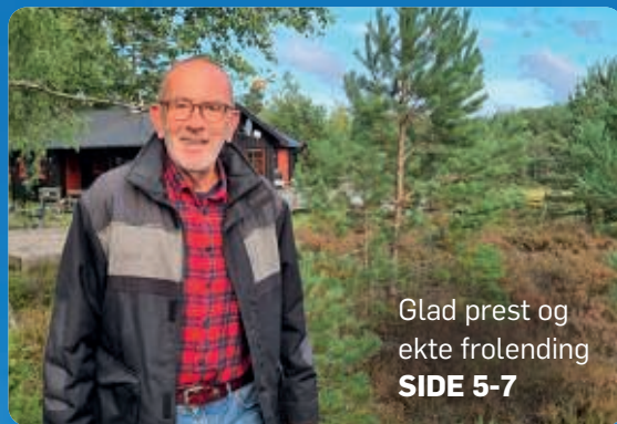
Glad prest og ekte frorending SIDE 5-7