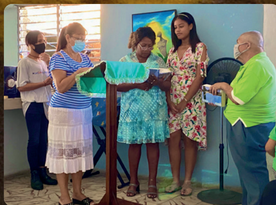
Besøk til Cuba