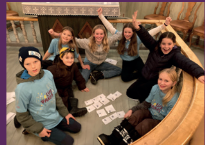
Her er en fornøyd gjeng som vant den store lagkonkurransen.