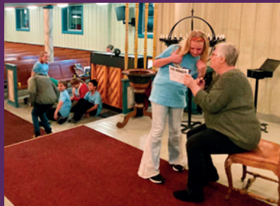
Lagkonkurransen der det gjaldt å gjette hva en på laget formet av plastelina.