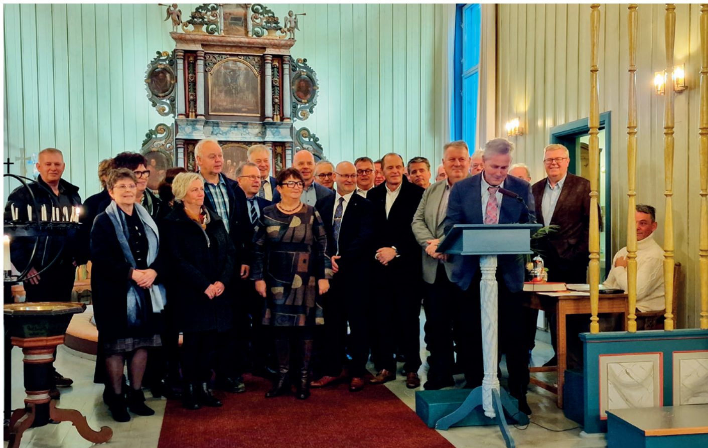
Gullkonfirmantene i Froland 2022.