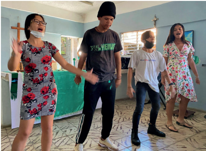
Aktive ungdommer deltar med sang og dans.