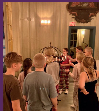
Like før leggetid hadde vi en rolig stund der deltakerne kunne tenne lys og be for noe eller noen.