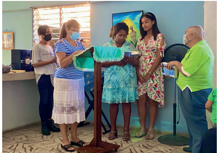
Det er «kø» for å lese tekster og bønner.

kirken. Dagen etterpå var det søndag, og vi fikk være med på gudstjenesten i Vår Frelzers kirke i 9. gate. Det var en opplevelse vi sent kommer til å glemme. Vi kom fram en halvtime før gudstjenesten skulle begynne. Da var menigheten allerede i gang med søndagsskole for voksne. 10 – 15 stykker deltok i opplæring fra Luthers lille katekisme. Menighetens diakon var lærer, og alle måtte lese fra Bibelen eller si fram forklaringene til de tre trosartiklene. Det var som å være med på en god, gammeldags konfirmasjonstime.