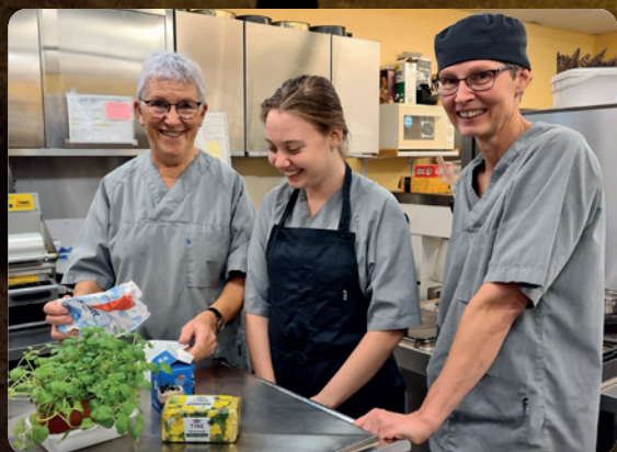
God jul på «Hjemmet»