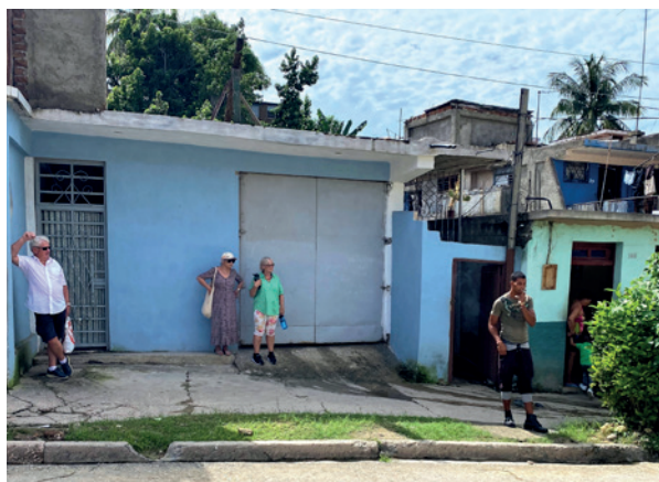
Menigheten holder til bak denne garasjeporten.