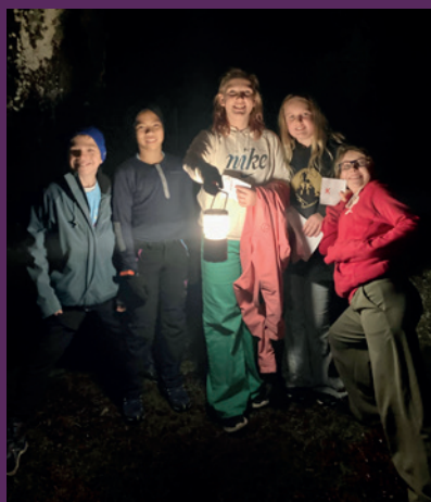
Lys våken deltakerne løste gåter både inne og ute lørdag kveld. Det var stort engasjement og mye godt lagarbeid.