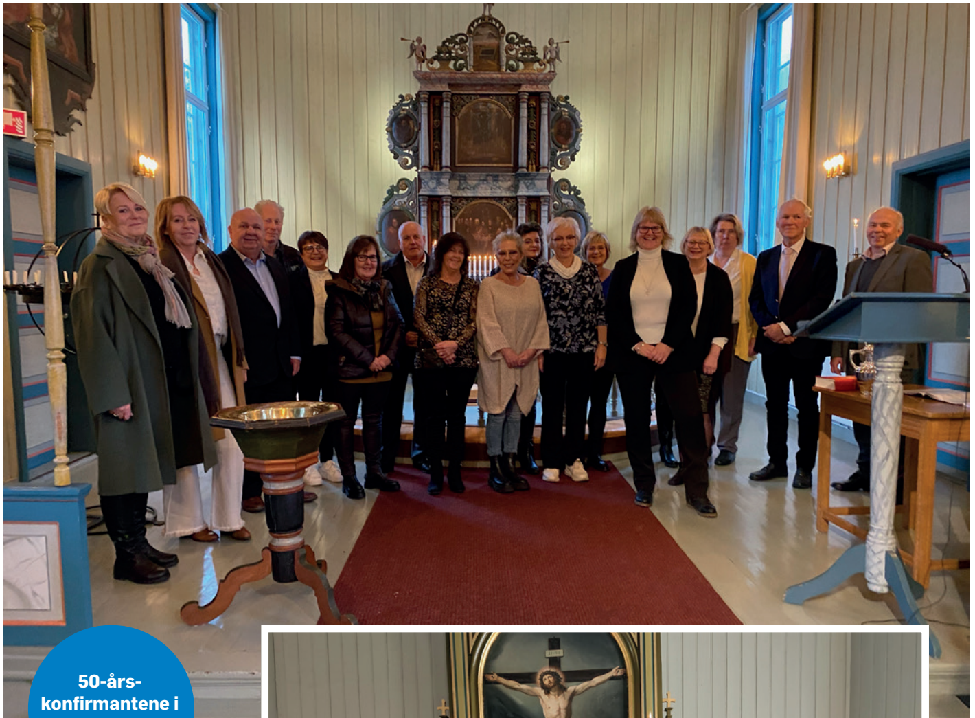
50-års- konfirmantene i Froland.