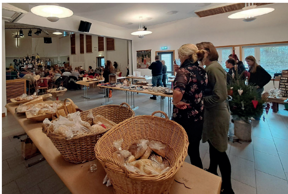
Mye gode bakervarer og annet å få kjøpt på markedet.

i menighetsregi og til utleie som Frolands 'storstue' for mange formål, kan vi konstatere at slitasjen blir godt tatt hånd om. Mange