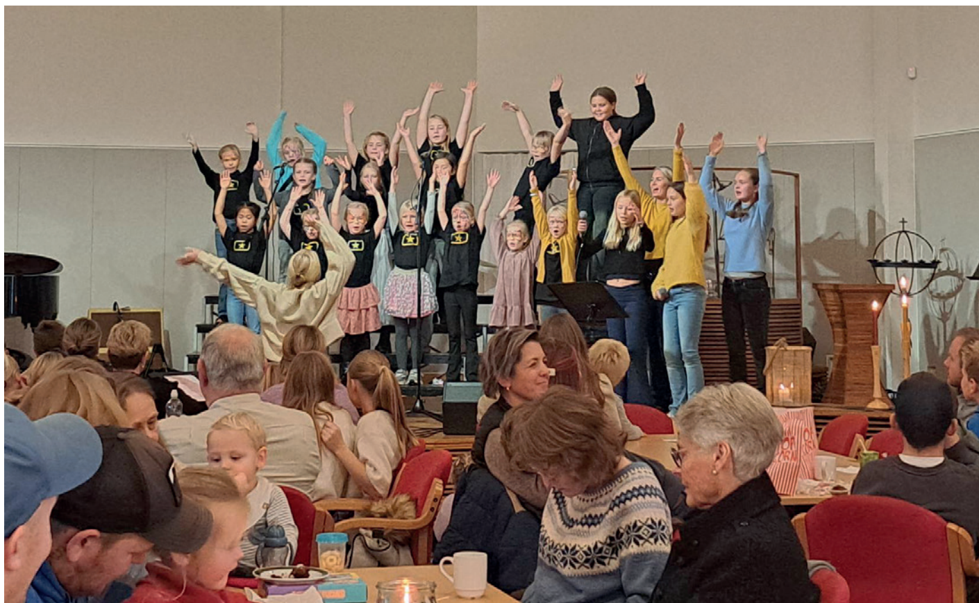
Soul Kids synger med stort engasjement og en ung og særdeles inspirerende dirigent