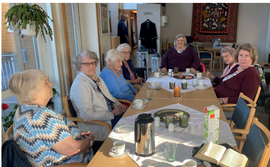
Her ser dere en flott gjeng, noen snart 100 år gamle, med mye humor og visdom!

Vi holder på en times tid, med hyggelig prat og fellesskap. Vi synger sammen, deler en bibeltekst, og prater litt om den, og ellers det vi er opptatt av i hverdagen.